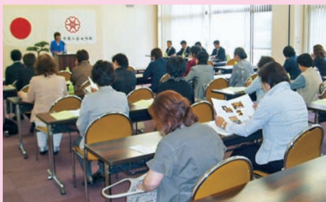
▲通常総会は一年間の総まとめです。部員みんな、やりたい事を話し合ったり、反省したりします。

合志市商工会女性部は人との出会いを大切に、一生の友として繋がりが出来る人間関係を目指しています。また、各部員の資質の向上のための勉強会も実施していきます。