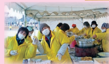
▲合志市民祭り・竹迫初市・カントリーマラソン大会で美味しいイモ天等を作っています。(和気あいあいです。)