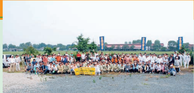
▲平成21年6月14日に合志市内においてクリーンキャンペーンに参加協力いたしました。