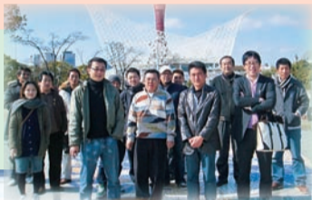
◀平成20年度は大阪、神戸への視察研修を実施しました。