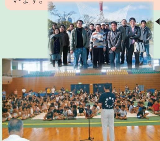
▲子供たちが健康でのびのびした精神を培うことを目的に商工会員や地元企業の協力のもと第20回ワンパクすもう大会を実施した。

商工会青年部は、商工会の事業を積極的に推進するとともに商工業の後継者たるべき経営者としての資質を向上させるために組織された団体です。