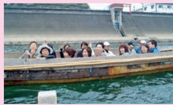
◀毎年、いろんな場所に視察研修に行きます。今年は人吉市方面に行ってきた。球磨川下りを体験。楽しかったです。