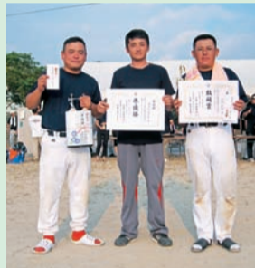
▲9月6日の熊本県商工会青年部連合会ソフトボール大会において2位となりました。