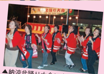
▲納涼盆踊り大会に女性部で参加。熱い夏の思い出です。